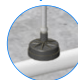
VERBINDUNG MIT PC TROPFER