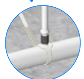
VERBINDUNG MIT UNIRAM™